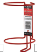
Support mural pour tube de 80