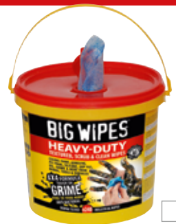
Seau de 240