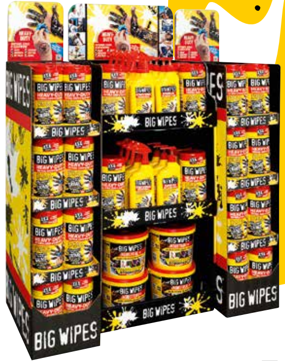
Présentoirs mixtes sur pied (FSDU) 32 x 80 tubes